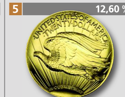
USA: Double Eagle Ultrahochrelief, 20 Dollars, Gold