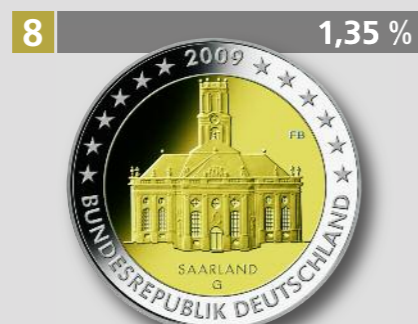
Bundesländerserie: Saarland, 2 €, Bimetall