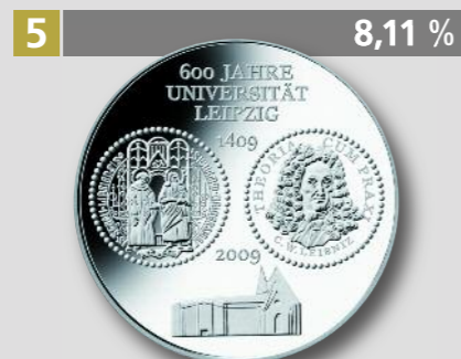
600 Jahre Universität Leipzig, 10 €, Silber