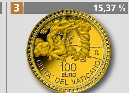
VATIKAN: 500 Jahre Sixtinische Kapelle, 100 €, Gold