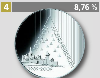
100 Jahre Jugendherbergen, 10 €, Silber