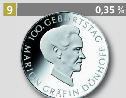
100. Geburtstag Marion Gräfin Dönhoff, 10 €, Silber

Das Prädikat „Münze des Jahres“ als Auszeichnung der Leserinnen und Leser des Deutschen Münzen Magazins gehört seit über zwei Jahrzehnten zu den begehrtesten numismatischen Prämierungen bei Münzämtern und Prägestätten. Aber auch die Teilnehmer selbst, unter denen wir attraktive Preise verlosen, können gewinnen.