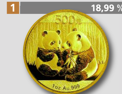
CHINA: Gold-Panda 2009, 500 Yuan, Gold

Allen Gewinnerinnen und Gewinnern unseren herzlichen Glückwunsch!