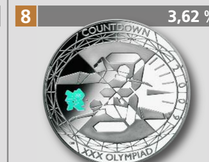
GROSSBRITANNIEN: Olympia London 2012, 5 Pfund, Silber