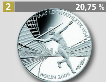
Leichtathletik-WM Berlin, 10 €, Silber