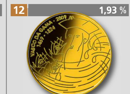
PORTUGAL: Geschichtsserie (Vasco da Gama), 1/4 €, Gold