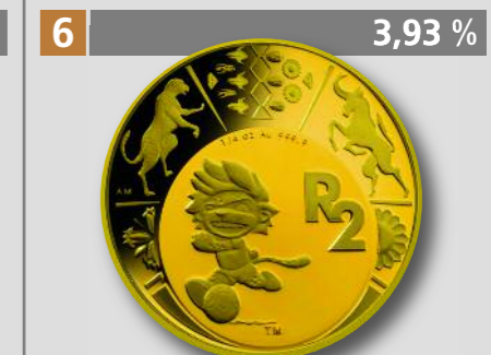
SÜDAFRIKA: Fußball-WM 2010, 2 Rand, Gold