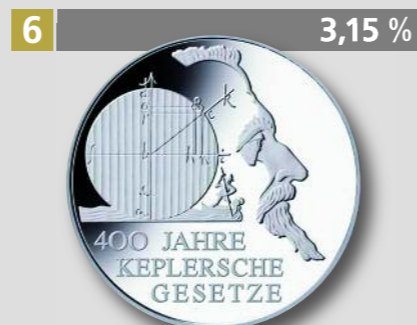
400 Jahre Keplersche Gesetze, 10 €, Silber