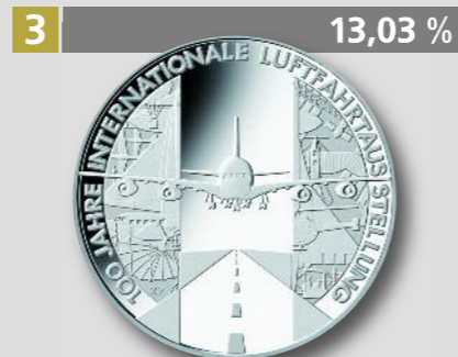
Internationale Luftfahrtausstellung Berlin, 10 €, Silber