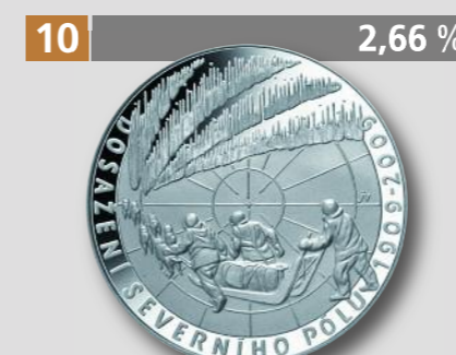
TSCHECHIEN: Internationales Polarjahr, 200 Kronen, Silber