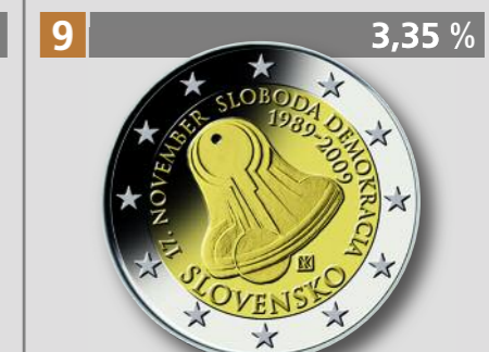
SLOWAKEI: 20 Jahre Demokratie, Freiheitsglocke, 2 €, Bimetall