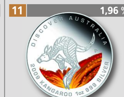
AUSTRALIEN: Discover Australia Känguru, 1 Dollar, Silber