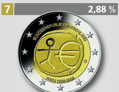
10 Jahre Wirtschafts- und Währungsunion, 2 €, Bimetall