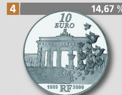
FRANKREICH: 20 Jahre Berliner Mauerfall, 10 €, Silber