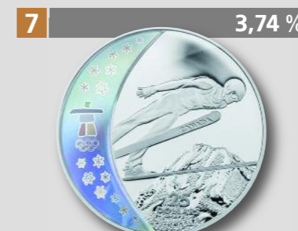
KANADA: Winterolympiade Vancouver 2010, 25 Dollars, Silber