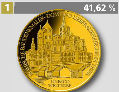
UNESCO Welterbe Tier, 100 €, Gold