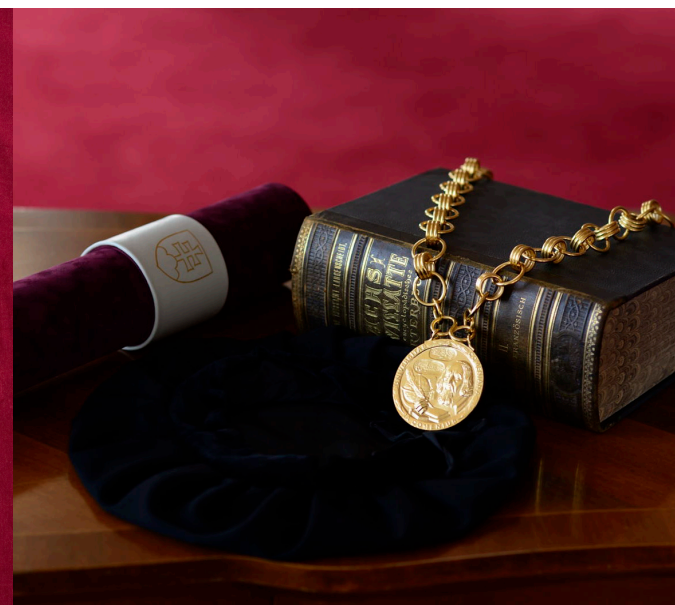
Reťaz a tubus s diplomom čestného doktora (Dr. h. c.)

V roku 1919, krátko po skončení prvej svetovej vojny, začala v mladom československom štáte svoju činnosť prvá slovenská vysoká škola univerzitného typu – Univerzita Komenského v Bratislave. Významnú úlohu pri jej vzniku a počiatočnom fungovaní zohrali profesori z pražskej Karlovej univerzity, ktorí spoločne so slovenskými kolegami prijali výzvu budovať najvyššiu slovenskú