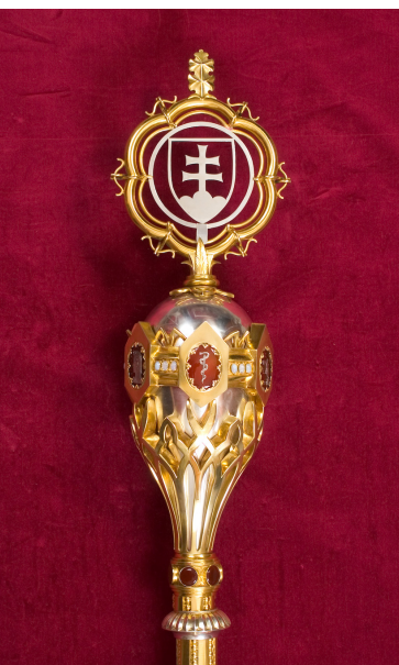
Žezlo rektora UK