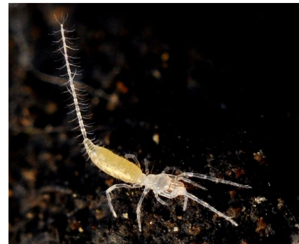
Štúrovka Eukoenenia spelaea , dĺžka tela 1,5 – 2 mm

Rokokové bábiky v Leknovom jazierku v Ružovej sieni, pôsobivé Zlaté jazierko a vzácne jaskynné živočíchy.