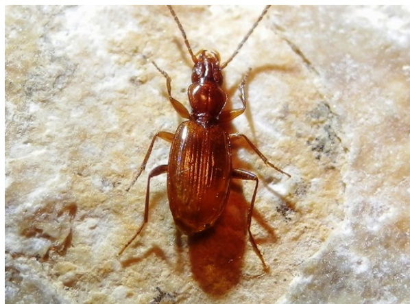
Duvalius microphthalmus spelaeus , dĺžka tela 4,5 mm

Na minci je zobrazený objaviteľ jaskyne a karbidka – acetylénová lampa ako svetlo, ktoré po prvýkrát preťalo podzemnú tmú v tejto jaskyni. Prvé objavy Demänovskej jaskyne slobody predstavovali stovky metrov riečnych chodieb bez výzdoby tvorené podzemnou riekou, štrkom, riečnymi sedimentmi a trojrozmernými labyrintmi. Výzdoba bola objavená až neskôr. Na minci nechýba ani symbol jaskyne