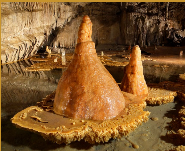
Rokokové bábiky v Leknovom jazierku v Ružovej sieni

Demänovská jaskyňa slobody je súčasťou Demänovského jaskynného systému, ktorého dĺžka presahuje 41 km. Zároveň je jeho najpestrejšou časťou – sú tu rozmanité formy sintrovej (kvapľovej) výzdoby rozličných tvarov a veľkostí hrajúce množstvom farieb a odtieňov, aj impozantné siene a dómy pospájané chodbami. Oči návštevníkov najviac upútajú sintrové lekná, špongiovité, koralovité a hroznovité formy výzdoby, ktoré sa vytvorili v jazierkach plnených zrážkovými vodami, mohutné sintrové vodopády, pagodovité stalagnáty či excentrické stalaktity. Jaskyňou preteká riečka Demänovka, ktorá vytvorila celý jaskynný systém.