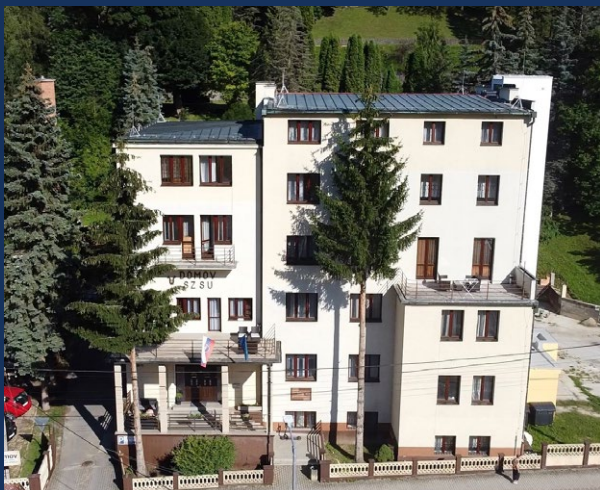
Budova Domova SZSU v Trenčianskych Tepliciach

Spevácky zbor slovenských učiteľov vznikol 3. marca 1921 v Trenčíne so sloganom Spevom budiť lásku k rodu. Impulz na jeho vznik dala snaha prehlbovať bratské vzťahy Slovanov, Slovákov a Čechov a povzniesť slovenský národ. Zbor je počas svojej nepretržitej 100-ročnej existencie celoslovenským amatérskym reprezentačným mužským speváckym telesom. Početnú prevahu v ňom majú učители, zastúpené sú však aj iné profesie. Trvalým sídlom sú Trenčianske Teplice a Domov SZSU, ktorý si členovia zboru v roku 1933 postavili s pomocou zbierok medzi učiteľmi. V roku 1961 zbor „odovzdal“ svoj majetok do rúk Revolučného odborového hnutia. Od roku 1968 dodnes je zriaďovateľom Domova SZSU Ministerstvo školstva, vedy, výskumu a športu SR. Spevácky zbor slovenských učiteľov počas svojho nepretržitého pôsobenia dosiahol prestížne výsledky. Patrí mu nezastupiteľné miesto v dejinách i súčasnosti slovenského školstva a kultúry.