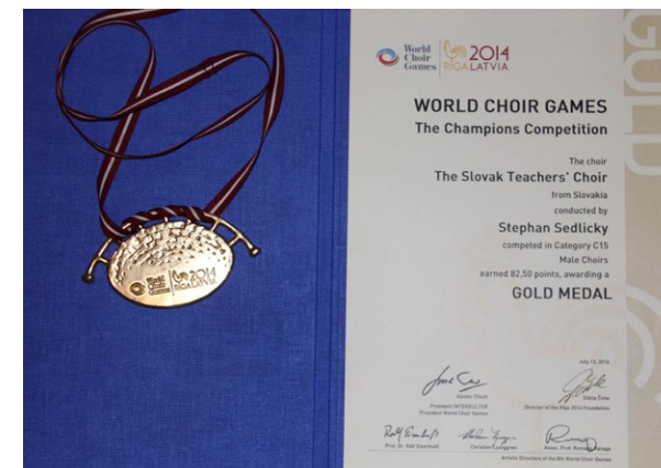
Zlatá medaila z 8. Svetovej olympiády zborového spevu, Riga 2014