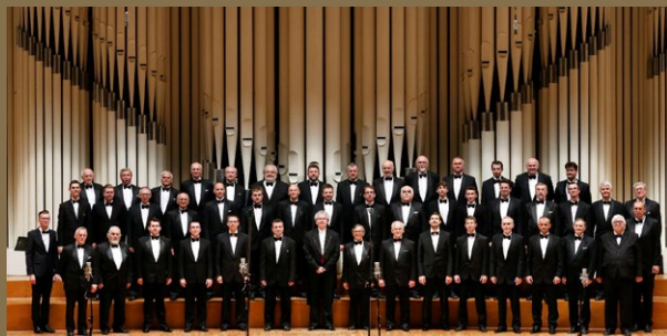
Spevácky zbor slovenských učiteľov – koncert v Slovenskom rozhlase pri príležitosti 95. výročia založenia

Na líci zberateľskej euromince je časť loga Speváckeho zboru slovenských učiteľov, ktoré tvorí profil ženskej tváre s rozviatymi vlasmi. V pravej časti loga sa nachádzajú štylizované iniciálky autora výtvarného návrhu loga, akad. soch. Mariána Polonského. V hornej časti mincového poľa je na linajkovej štruktúre štátny znak Slovenskej republiky a pod ním nápis SLOVENSKO. V dolnej časti mincového poľa je označenie nominálnej hodnoty 10 EURO. Nad ním je zjednodušená silueta trenčianskeho hradu s nápisom TRENČÍN 1921, nad ktorou je letopočet 2021. Značka Mincovne Kremnica, štátny podnik, ktorú tvorí skratka MK umiestnená medzi dvoma razidlami a štylizované iniciálky autora zberateľskej euromince ak. soch. Zbyňka Fojtů ZF, sú pod letopočtom.