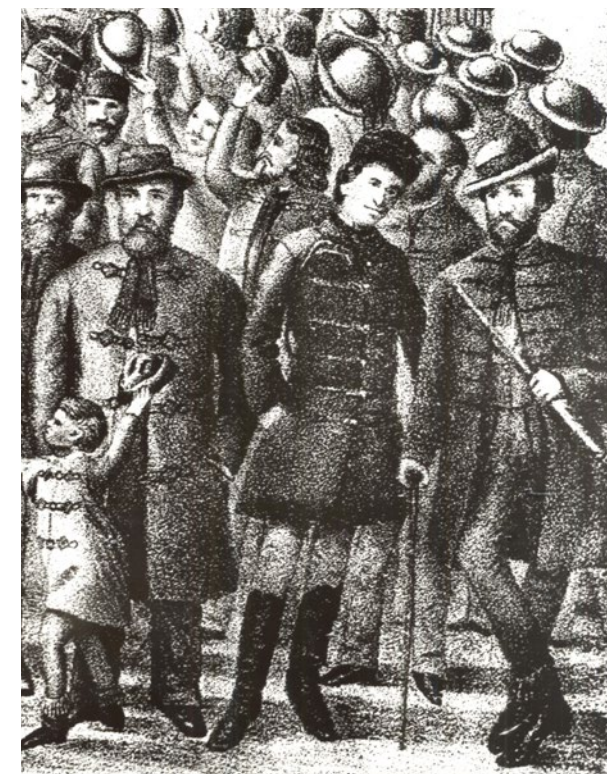
Výrez z rytiny Memorandové zhromaždenie v Martine v roku 1861, údajne prvý sprava je zobrazený Janko Král'.

Podobu Janka Král'a nepoznáme. Zachovala sa iba jedna nejasná fotografia, na ktorej má na hlave baranicu. Zo spomienok rovesníkov vieme, že mal tmavé rozčuchané vlasy, iskrivý pohľad a akúsi divokosť manierov. Chodil s paličkou, čo bol dôsledok zaobchádzania v žalári.