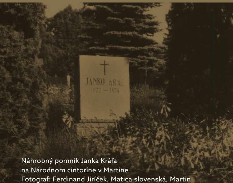
Náhrobný pomník Janka Kráľa na Národnom cintoríne v Martine

Na rube zberateľskej euromince je fiktívny portrét Janka Kráľa. Vľavo od neho je v opise meno a priezvisko JANKO KRÁL. Vpravo sú v opise letopočty jeho narodenia a úmrtia 1822 - 1876.