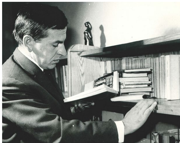
Civilný portrét z roku 1965 po premiére filmu Obchod na korze

vadelnej a neskôr aj televíznej inscenácii, ktorá predznamenala jeho úlohy v komediálnom repertoári. V jeho komediálnom prejave dominovalo nákazlivé, iskrivé komediantstvo, prirodzená ľahkosť a radosť z hry.